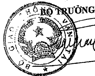
Đinh La Thăng