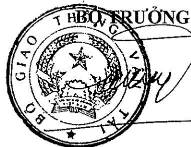
Đinh La Thăng