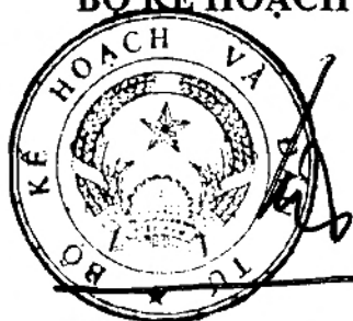
Bùi Quang Vinh