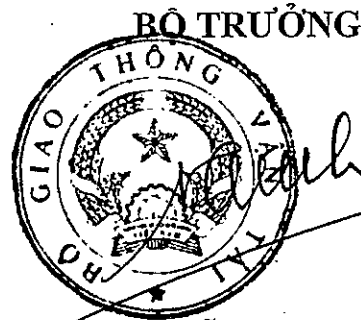
Nguyễn Văn Thể